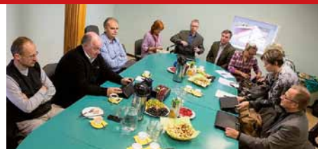
Streigikoosolek aasta tagasi.

Lastehaigla streigis ei osalenud, sest streigikomisjon otsustas, et lastele ei tohi teenuse kättesaadavus halveneda. Kuid ka lastehaigla lootis, et haigekassa lepingumaht kasvab uut palgakomponenti ja koormusi arvestades suurusjärgus 10%, aga suurenes 4,2%. See tõus peab haigekassa kirjelduste kohaselt sisaldama hea kättesaadavuse tagamist, uute ravimeetodite juurutamist, sh uue aparatuuri kasutusele võtmist ja hindade korrektsiooni, mille üheks osaks on ka palk. Kui lepingumaht kasvas 2013. aastal 2012. aastaga võrreldes 4,2%, siis arstide töötasu kasvas aastaga 9,2%, sellest põhjalga arvelt 4,6%. See tähendab, et suur osa sissetuleku tõusust on ületöö ja lisatasude arvelt. Miinimumpalka ei saa lastehaiglas ükski arst. Nagu ka teistes haiglates, oli meil õde-